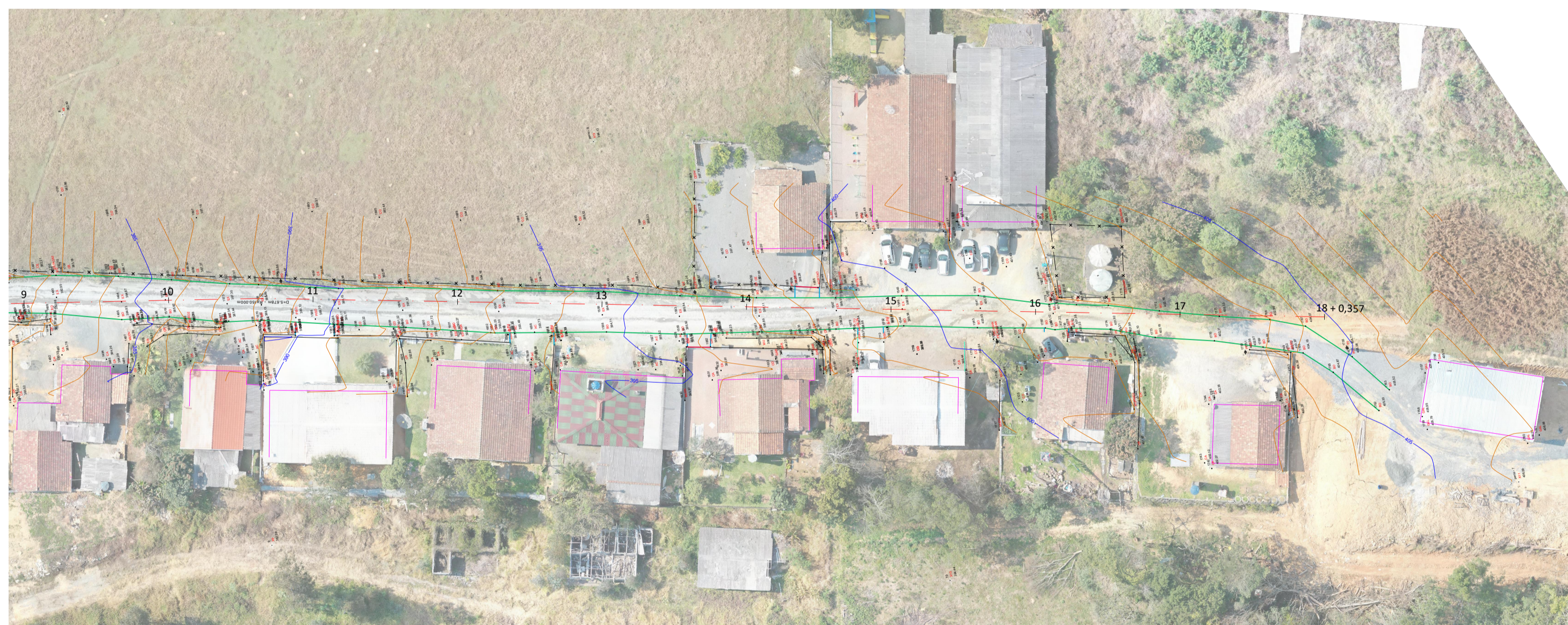
Planta Baixa Est: 9 + 0,00 à 18 + 0,357 Esc: 1/500