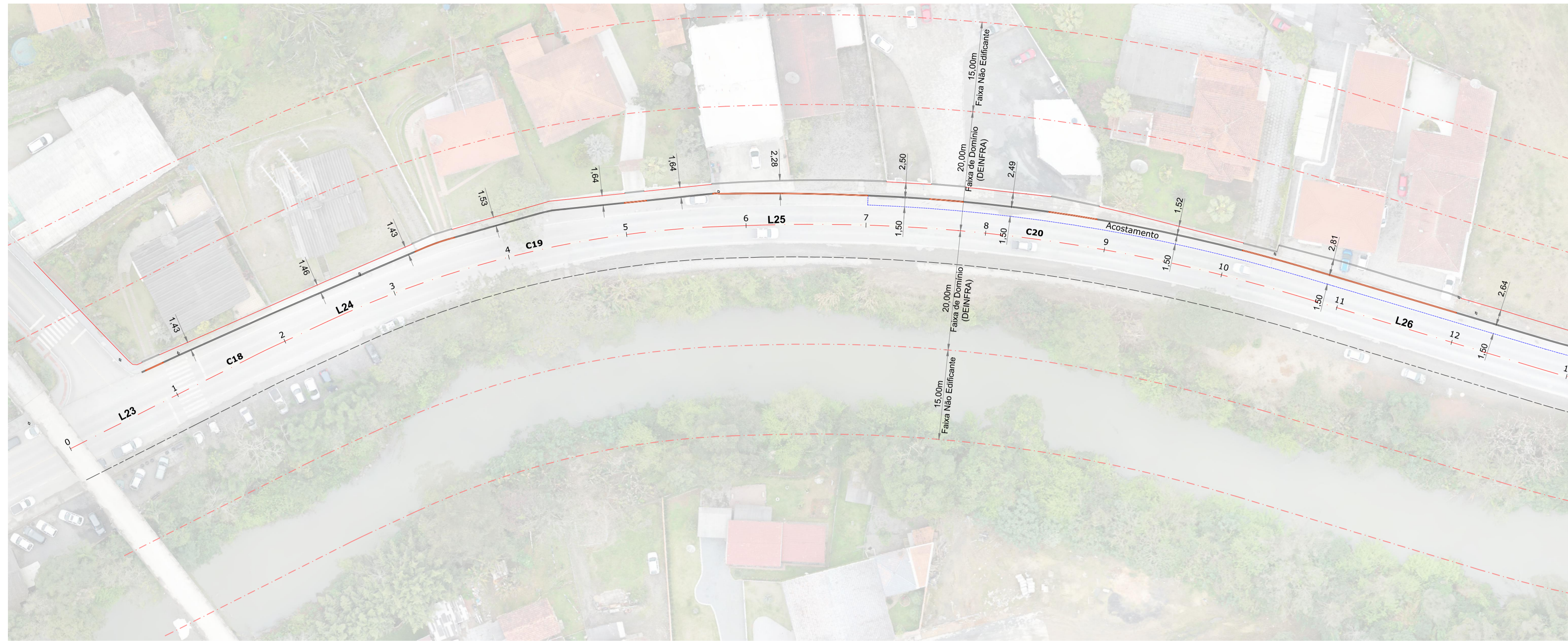
Planta Baixa Est: 0 + 0,00 à 13 + 0,00 Esc: 1/500