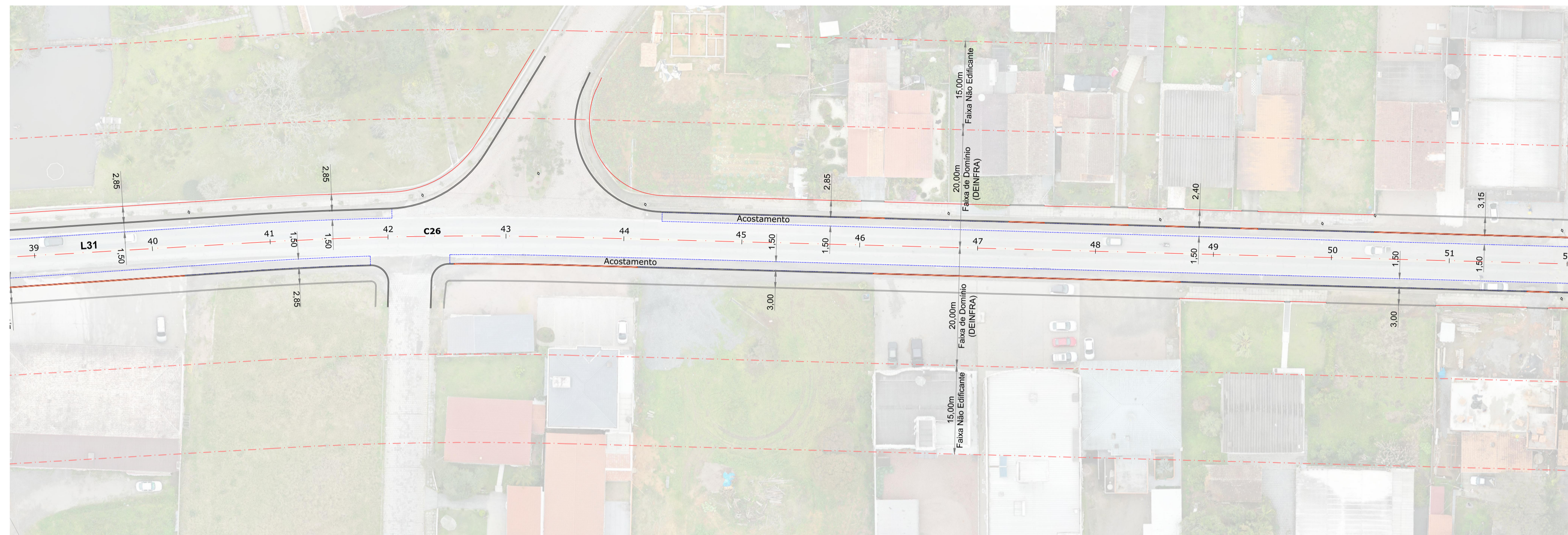
Planta Baixa Est: 39 + 0,00 à 52 + 0,00 Esc: 1/500