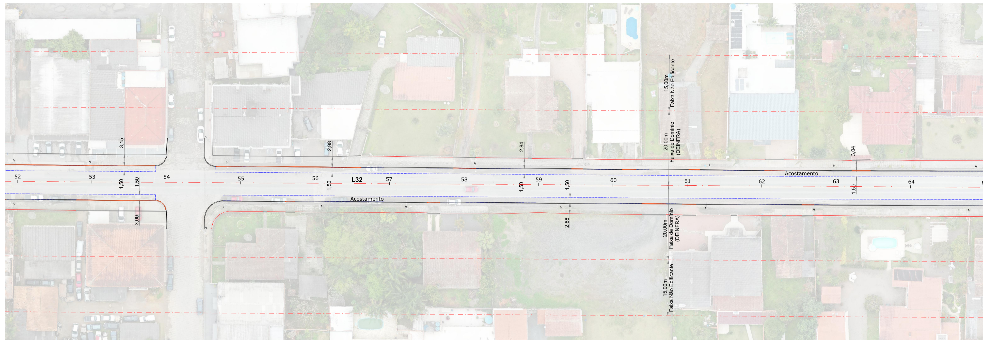
Planta Balza Est: 52 + 0,00 à 65 + 0,00 Esc: 1/500