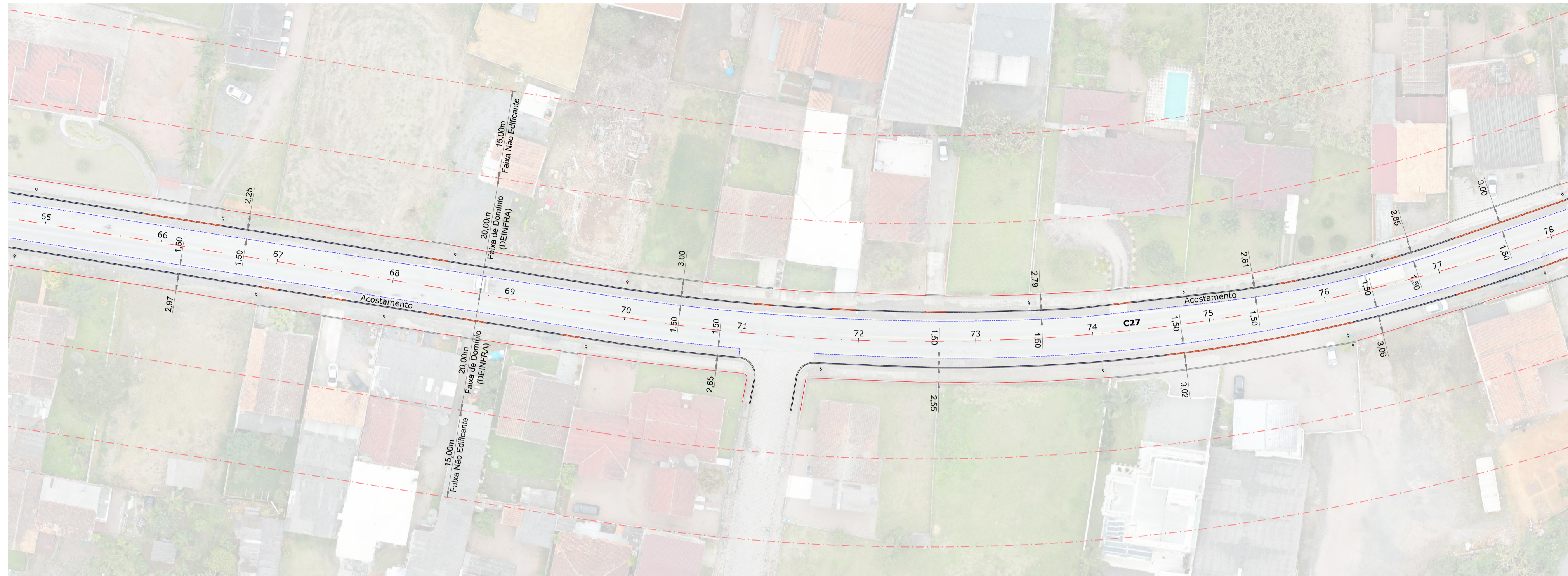
Planta Baixa Est: 65 + 0,00 à 78 + 0,00 Esc: 1/500