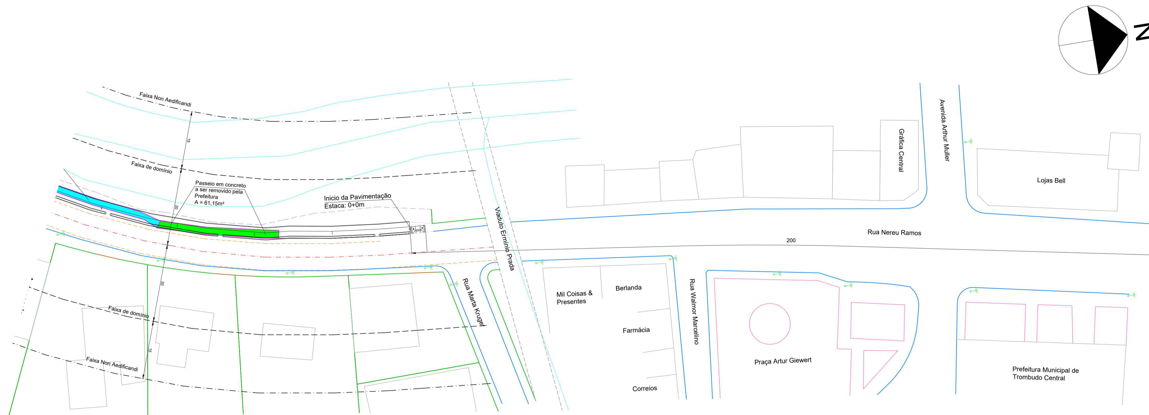
PLANTA DE REMOÇÃO ESC 1/500