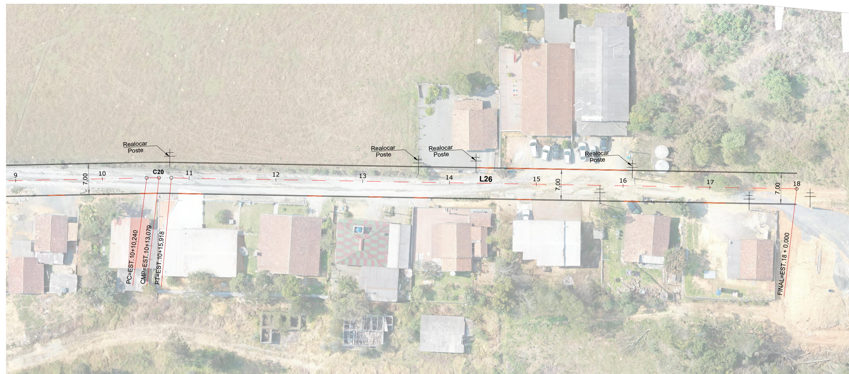
Planta Baixa Est: 9 + 0,00 à 18 + 0,00 Esc: 1/500