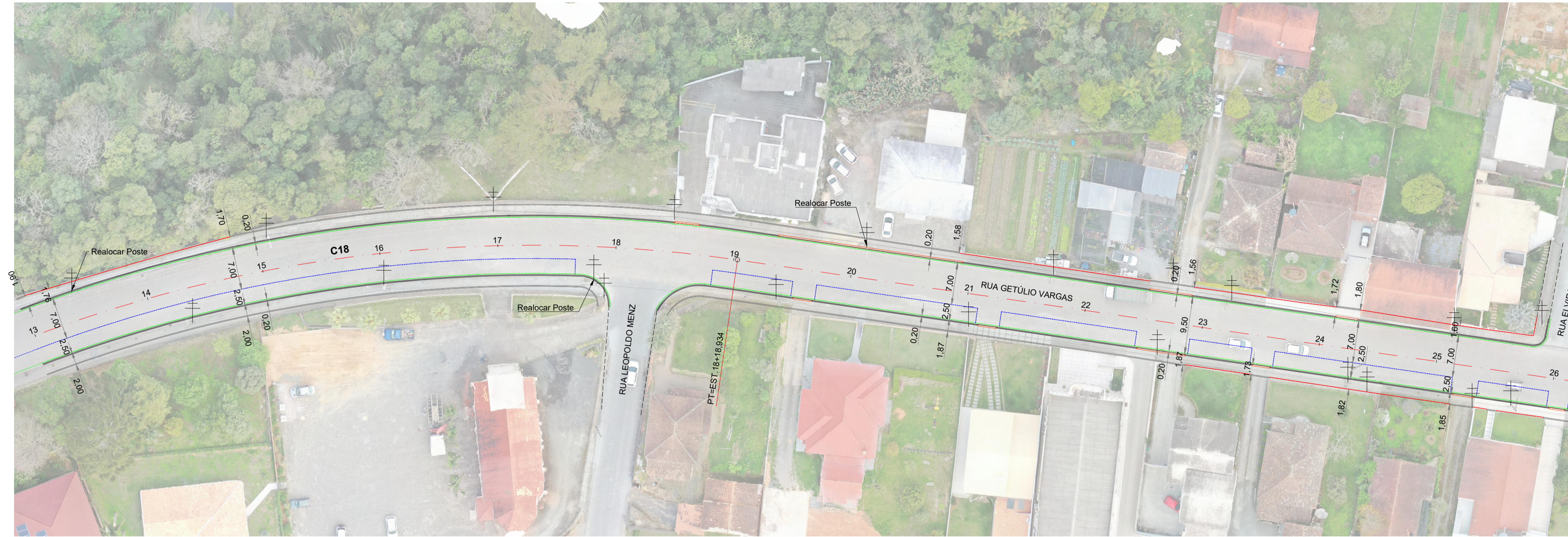
Planta Baixa Est: 13 + 0,00 à 26 + 0,00 Esc: 1/500